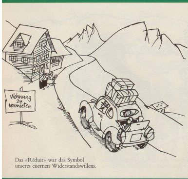
Das «Réduits» war das Symbol unseres eisernen Widerstandswillens.

Man liebt die alten Sachen – aber sie sollen möglichst wie neu aussehen! WFR