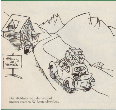
Das «Réduits» war das Symbol unseres eisernen Widerstandswillens.

Man liebt die alten Sachen – aber sie sollen möglichst wie neu aussehen! WFR