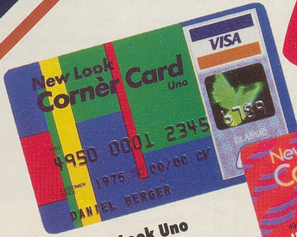
New Look Uno