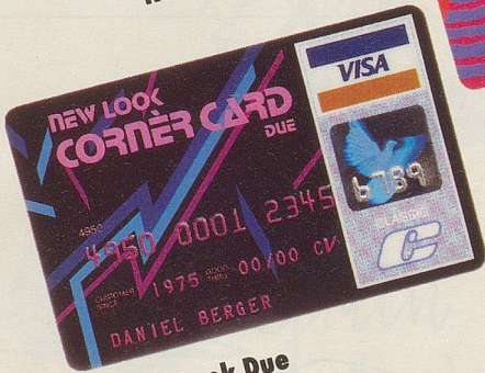
New Look Due