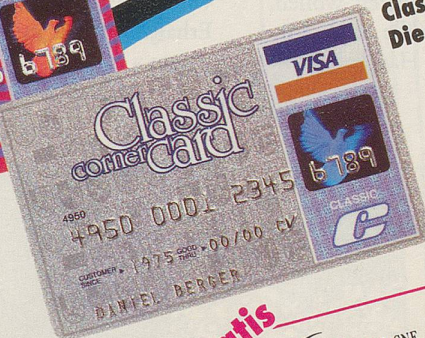
Classic Die Traditionelle