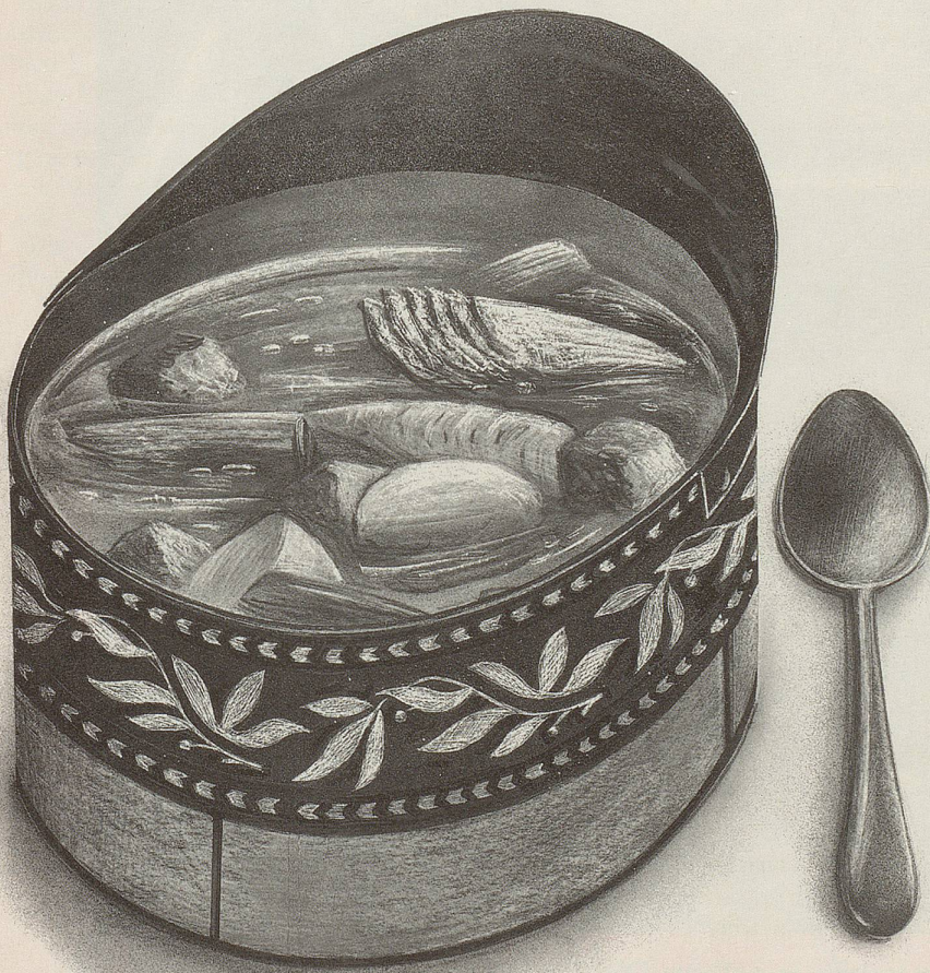
DANIEL ROHRBA (CH)

Berühmt werden ist ganz einfach: Anmeldetalon ausfüllen, nicht frankieren, absenden – man ist dabei. Im nach dem Abgang des Flüchtlingsdelegierten neu zu schaffenden Amt für Verkehrs- und Ausländerfragen sind noch zahlreiche Stellen für profilierungswillige CH-Bürger mit gutem Leumund und Führerausweis Kategorie B zu besetzen.