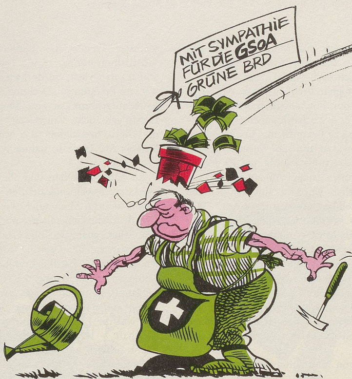
Die Schweizer Grünen und die «Gruppe für eine Schweiz ohne Armee» (GSoA) haben ungebetene «Unterstützung» aus der Bundesrepublik angeboten bzw. aufgedrängt erhalten.