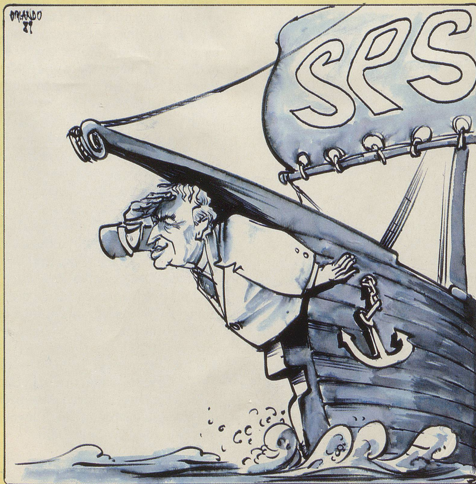
Ausschau nach passendem Nachfolger

Doch eben: Das Aufsichts-Gremium wird in den Augen des Bundesrates zum Auftisch-Gremium. Und dann räumt die Landesregierung ab, als ob Büchsenwerfen