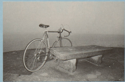
Er seufzt und sinkt von seinem Rad, geschafft vom Bodensee-Velo-Such-Pfad.*