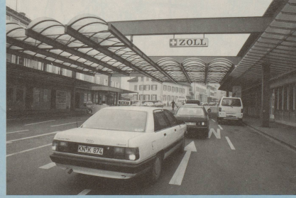
Ja endlich! Am Zoll weiss man wohl Rat, und wo der See den Radweg hat.