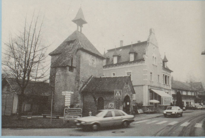
Es steigt aus dem Nebel Haus um Haus, doch er muss immer geradeaus.