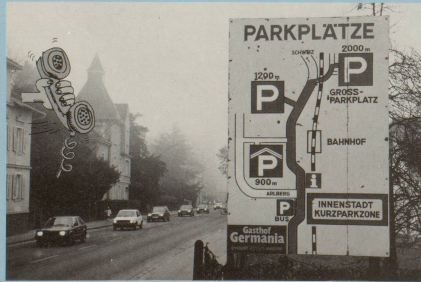
Er schüttelt den Kopf, es sträubt sich sein Haar, ...