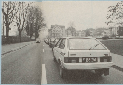
Auf schlimmem Weg und nicht allein, fährt er Autos und Abgasen hinterdrein.