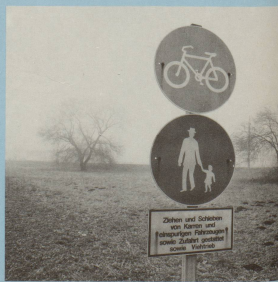
... er glaubt nicht, dass das schon alles war.