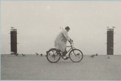
Der Radler startet zur grossen Tournee, er will noch heute 'um den Bodensee.