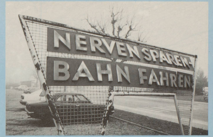
Sein Auge auf den Hinweis schiebt, der ihm den rechten Weg empfiehlt.