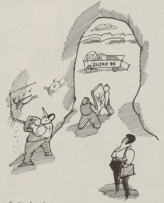
Späte Anerkennung eines unbekannten Künstlers.