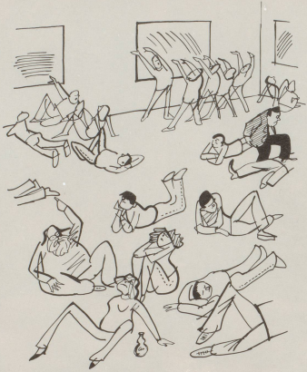
Der neue Beruf: Kunstanimator