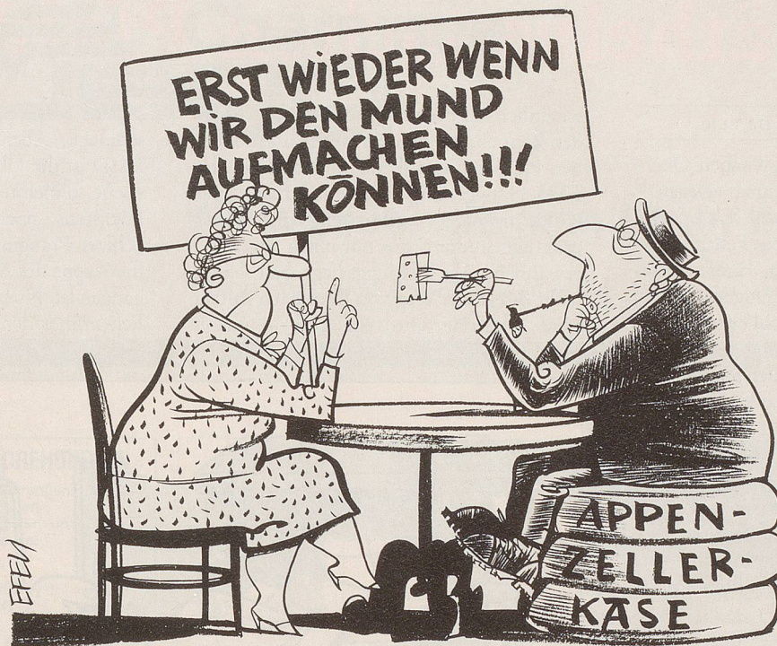
Als Reaktion auf die Ablehnung des Frauenstimmrechts in Appenzell Innerrhoden wollen viele Frauen keinen Appenzeller Käse mehr kaufen. Diese Käsesorte wird auch in Ausserrhoden und im Kanton Thurgau produziert – was man dem Käse nicht ansieht ...