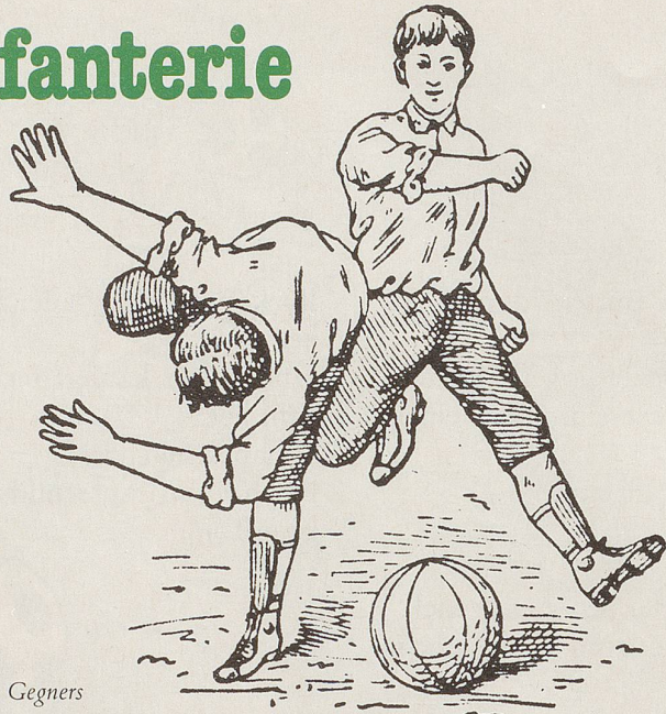
Anrennempeln eines Gegners

Die Gräfin zitierte aus einem mit «Heer und Sport» überschriebenen Artikel des Kompaniechefs Scheibert, aus dem hervorging, dass Fussball alle Momente enthalte, die im Kriege den moralischen Wert des Mannes ausmachten. Zu den besten seelischen Eigenschaften des (damals) modernen Soldaten gehöre «ein zäher Charakter, ein heisses Herz und ein zu raschem Entschluss fähiger, aufgeweckter Kopf». Um diese Forderungen zu erfüllen, könne ein Sport dienen, «der billig und interessant» sei, keine übergrossen Vorkenntnisse ver-