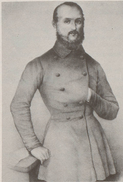
Gustav (von) Struve, der «mutmassliche» erste deutsche Staatspräsident für vier Tage. Er sorgte dafür, «dass die Dinge in Fluss kamen». Dafür hängt er jetzt im Lörracher Heimatmuseum ...