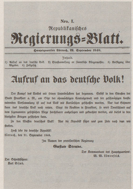
So sah das Titelblatt der allerersten (gesamt)deutschen Zeitung aus. Unten rechts signierte M. W. Löwenfels als Deutschlands General Nr. 1.