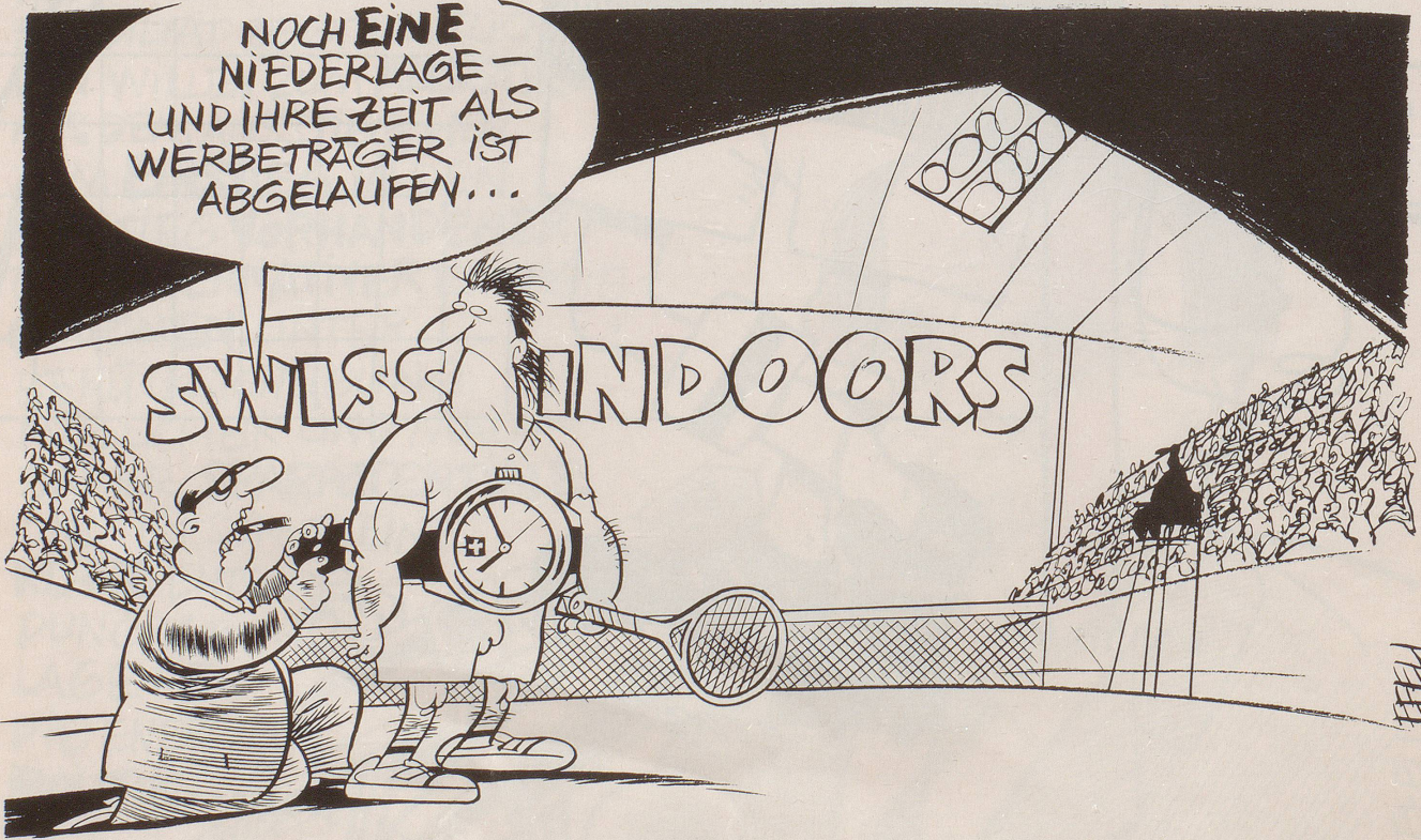
Swiss Indoors: Spiel & Kommerz ...