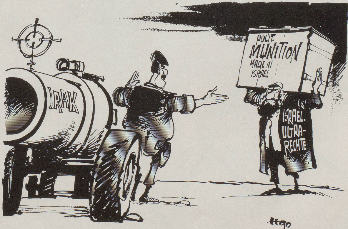
«Allah sei Dank, ich dachte schon, ich bin völlig isoliert!»