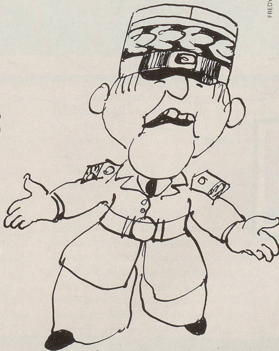
Grossdeutschland, ein Hoffnungsschimmer!