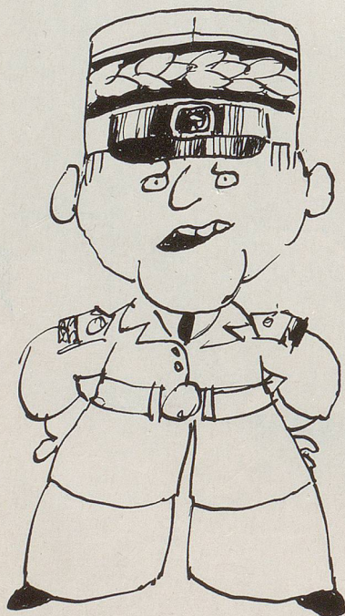
Meine F-18-Flugi wollen Sie mir streitig machen!

Mehrere Kilometer lang sind noch heute die Warteschlangen der Telefonkunden in spe, die einen Anschluss beantragen. Im Juli 1988 waren es deren 400 000, heute sind es schon 1,1 Millionen. Die Wartezeiten betragen zwischen drei und 18 Monaten. Viele ausländische Firmen, die auf Anschlusszuteilung warten müssen, versuchen sich gegen viel Geld bei einem Unternehmen einen Nebenanschluss zu sichern. Zu Spitzenzeiten brechen die Ortsnetze zusammen, eine Tonbandstimme rast: «Rufen Sie in einigen Minuten wieder an, das Netz ist total überlastet.» Der jährliche Telefonbuchum-