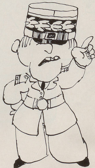
Das Friedensgefasel geht mir allmählich auf die Nerven!