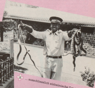
8 ...ausschliesslich einheimische Zutaten.