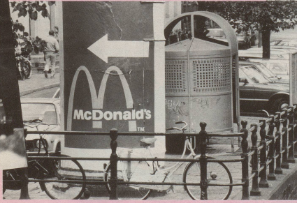
7 Schweizer Eigenart ist Trumpf! Selbst die neuen Gastronomieketten verwenden für ihren Frass ...