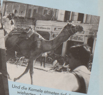
Und die Kamele atmeten tief durch und wieherten, dass die Höcker zitterten.