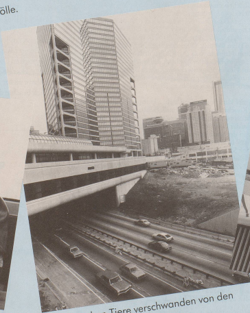
Die störrischen Tiere verschwanden von den Strassen.