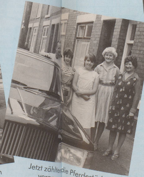
Jetzt zählst du Pferdestärken, und vergessen waren die Kamele, ...