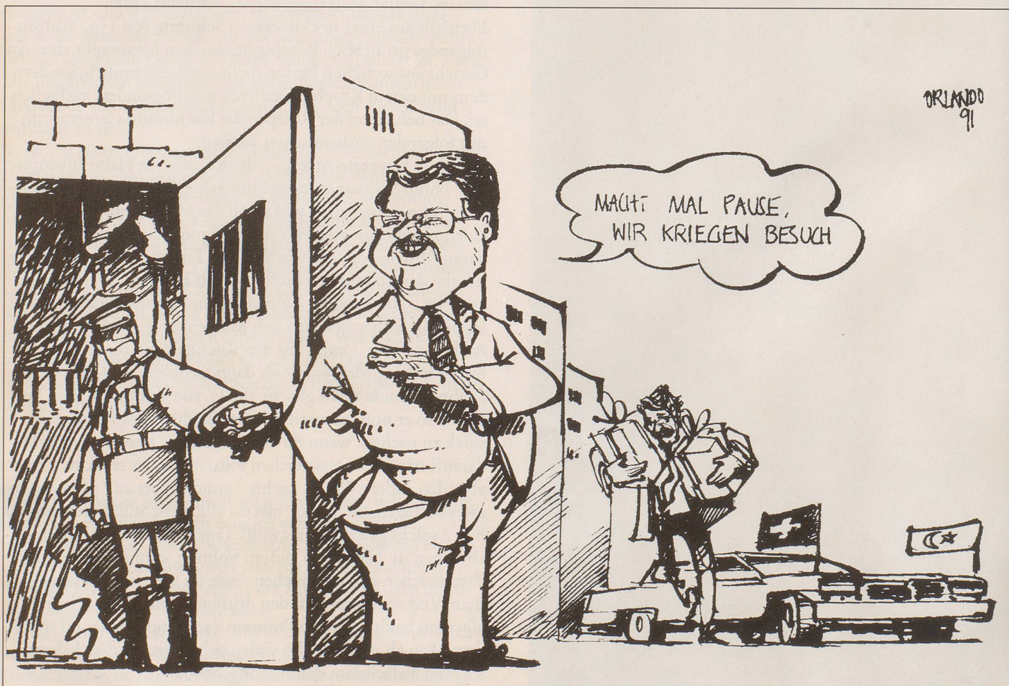
Bundesrat Felber auf Nahost-Reise ...