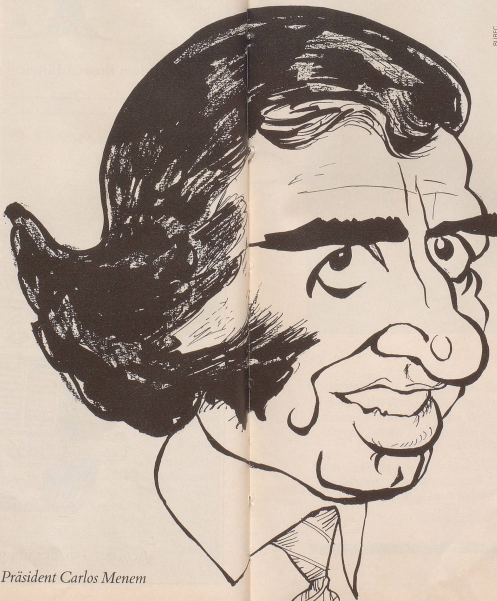
Präsident Carlos Menem

Die argentinische Bischofskonferenz verdammt «die generell gewordene Korruption, die uns als Personen und als Gesellschaft zerstört», durch Drogenhandel, Bestechung, Verbrechen, üble Nachrede, Verleumdung. Einen positiven Punkt hob ihre Erklärung hervor: Dass das Volk nach und nach seine Angst vor den Grossen verliert und seine Stimme zur Anklage erhebt.