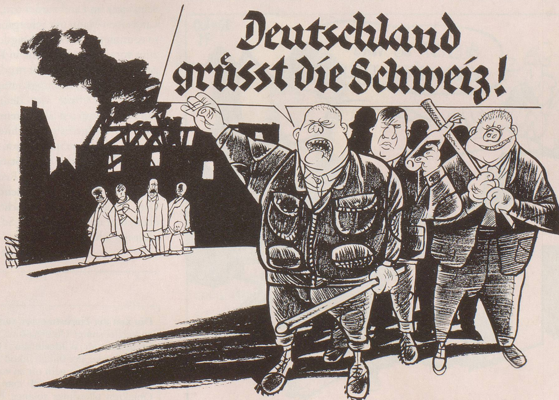
Molotow-Cocktails gegen Asylbewerber-Unterkünfte auch in Deutschland.