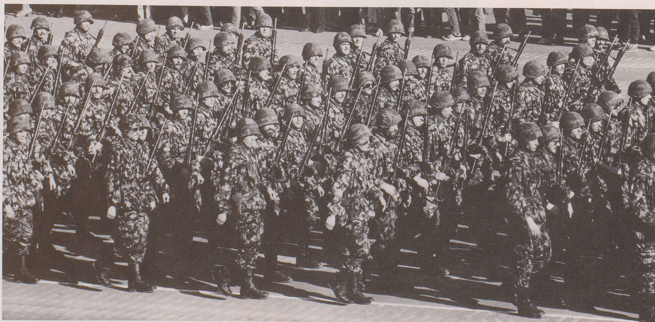
Schwer, unbequem und nach heutigen Vorstellungen vollkommen ungeeignet: die legendäre Eisenrüstung für die Fusstruppen (hier mit hochgeschobenem Helmvisier getragen).