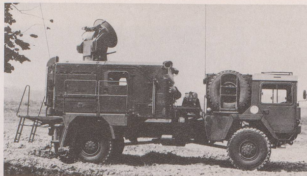
Die Historiker streiten sich darüber, wofür und vor allem ob überhaupt so etwas je gebraucht werden konnte. Verglichen zu den anderen Kriegswerkzeugen aus dieser Zeit wirkt es ausgesprochen plump und schwerfällig.