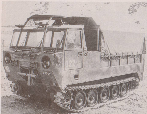
Dieses Gefährt beweist den Mut der alten Krieger. Wer würde heute noch auf so ein Ding steigen, um sich auf das Schlachtfeld transportieren zu lassen: Raupentransportierwagen 68 (vermutlich 1168, das Herstellungsjahr).