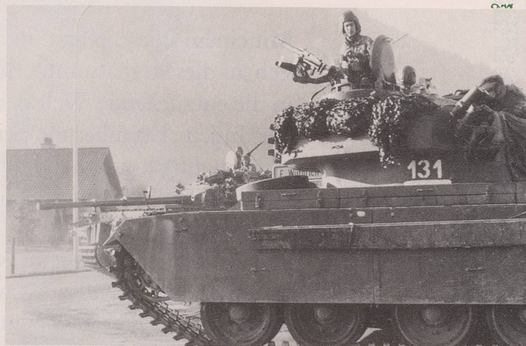
Schon damals vollkommen veraltet und trotzdem – vor allem in den verlorenen Schlachten um die EG-Bastion – von den Schweizern hartnäckig immer wieder eingesetzt: der Centurion-Panzer.