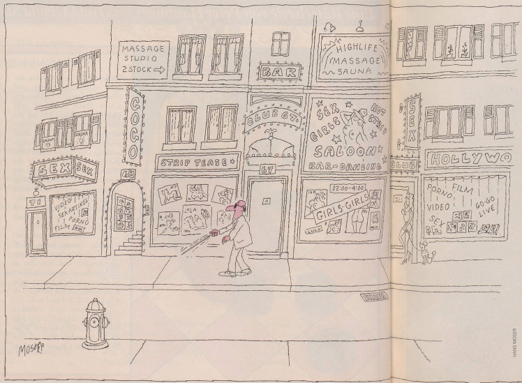
Illustration: M. B. 1991

Warum denn in der Ferne beißen, sich, der Pöster kommt so nah. jm