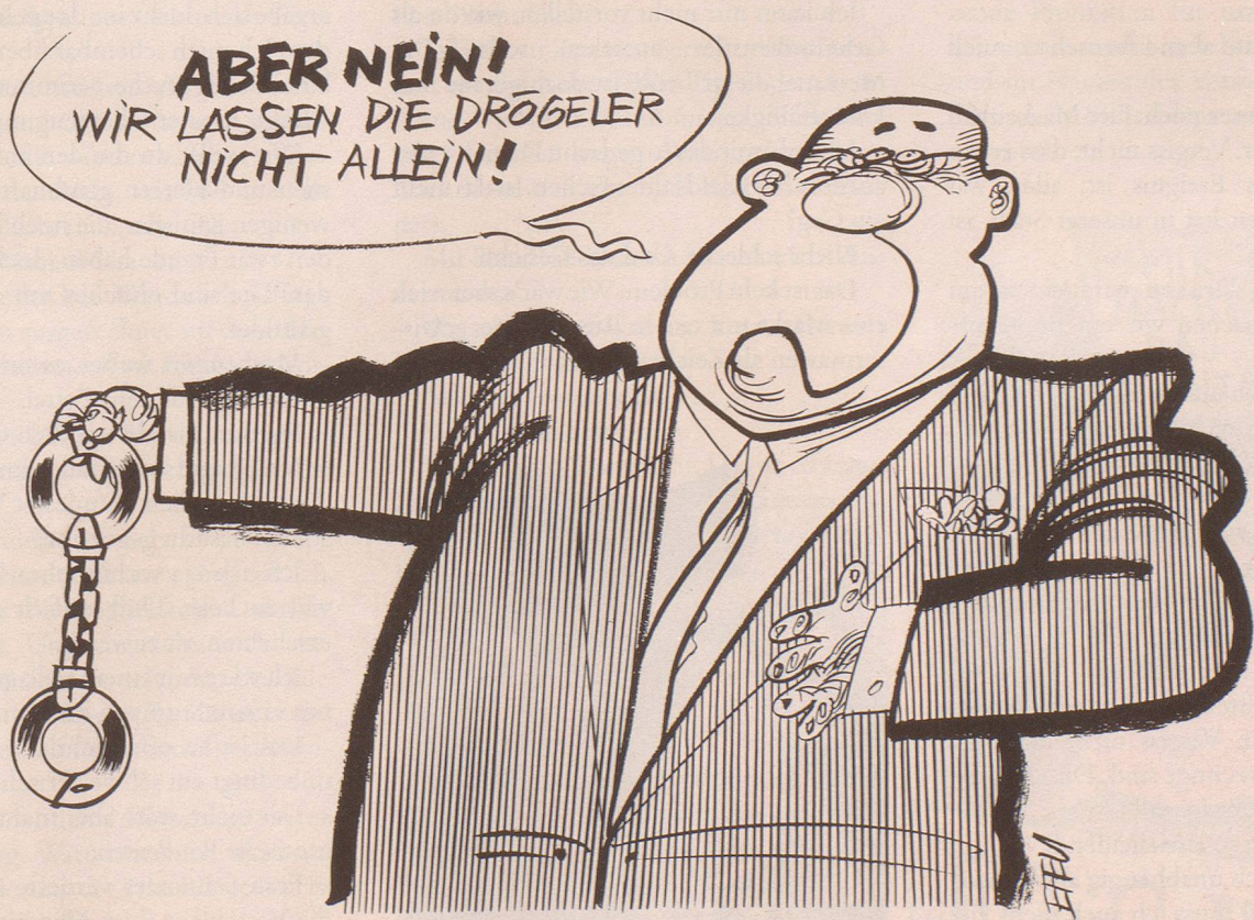
Die neue alte Drogenpolitik des Bundesrats.