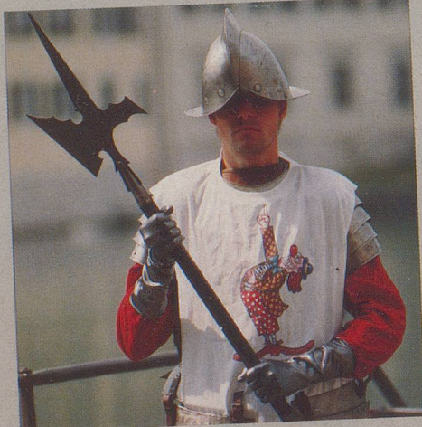
... und rüstige Herren...