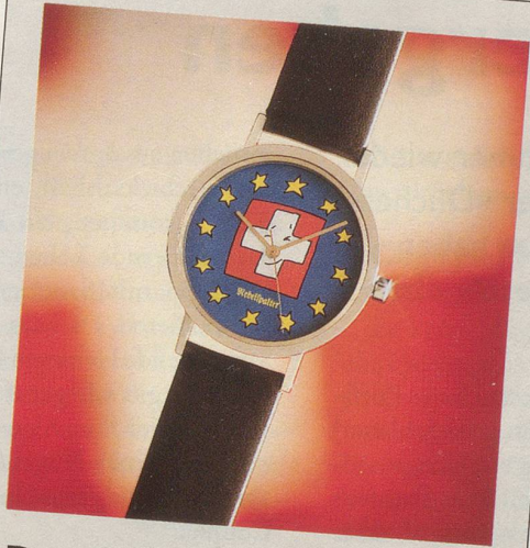
Das Zeitzeichen ...