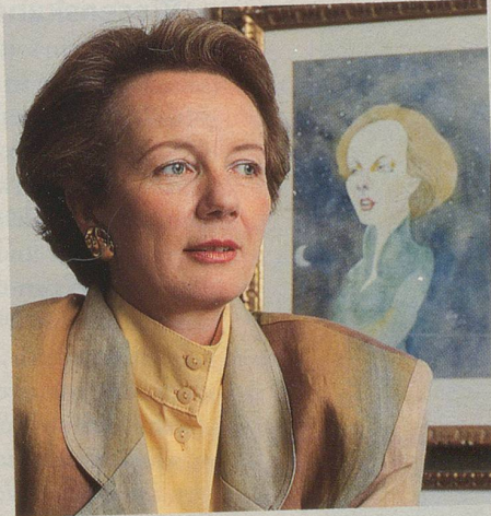
... mit Volldampf auf Europa zu ...