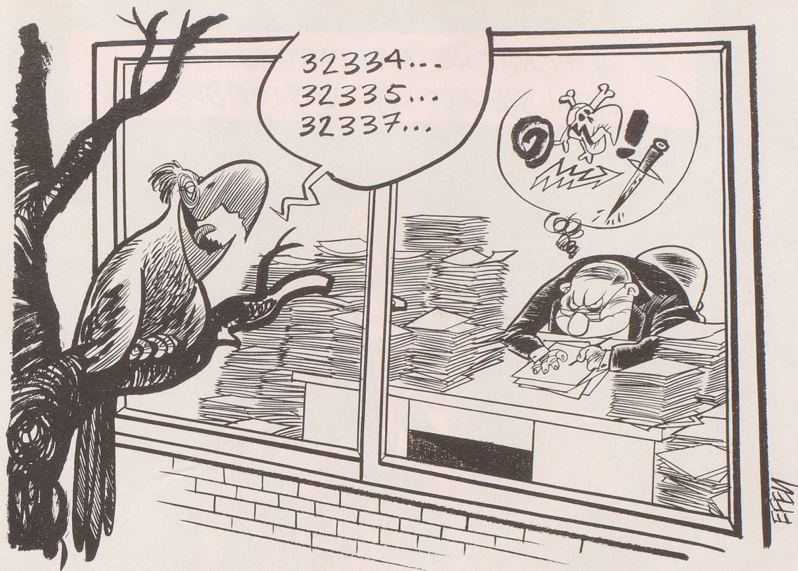
Aus unerfindlichen Gründen haben sich die Bundesbeamten beim Zählen der Unterschriften für das NEAT-Referendum verrechnet ...