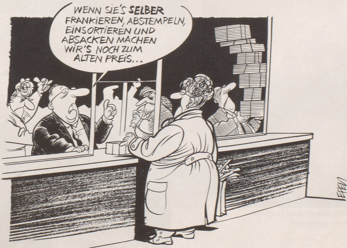
Die PTT versuchen, ihre Verluste wegzurationalisieren.