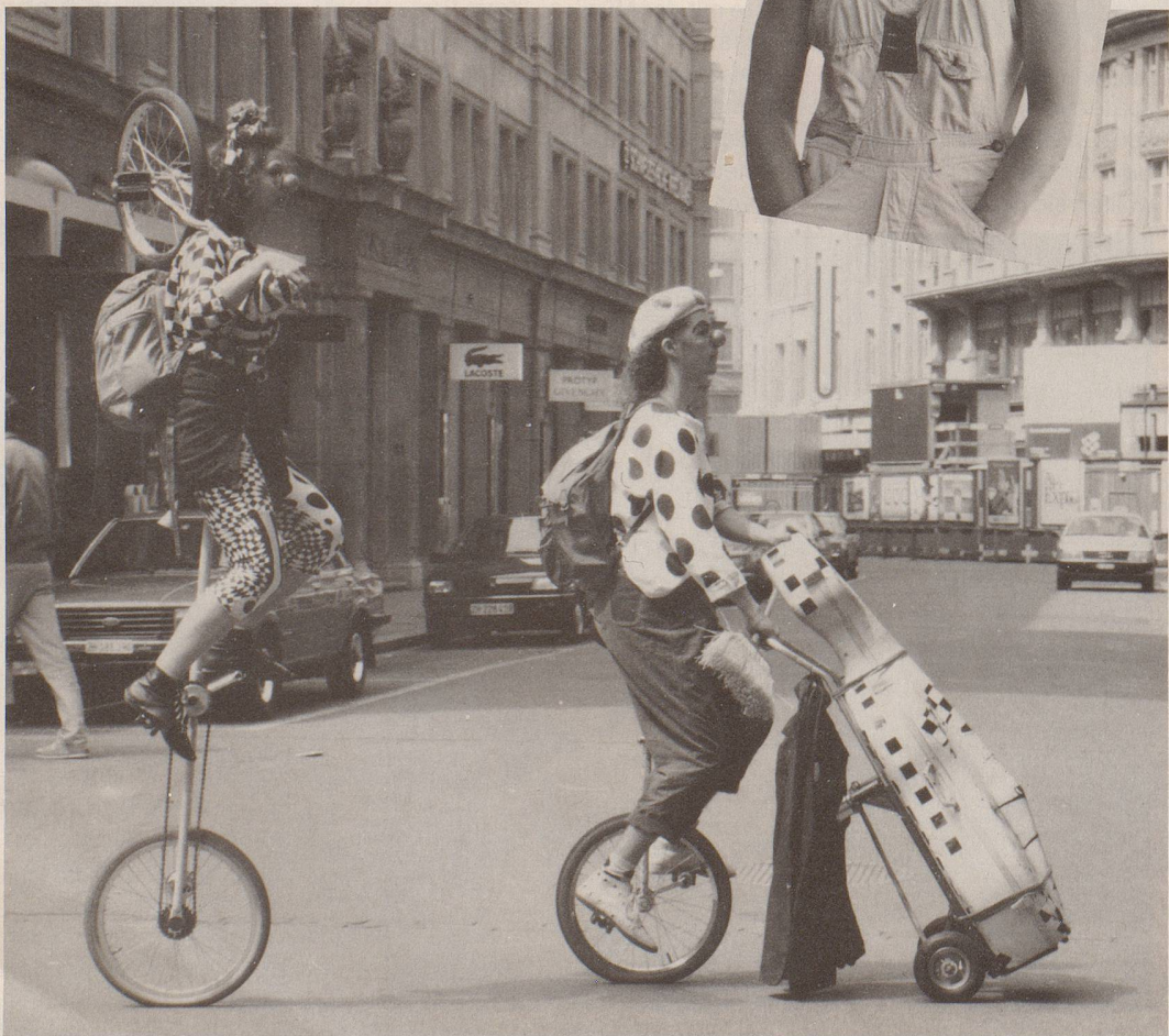
Das tägliche Leben bietet so viel — wenn man nur weiss, sich richtig zu bewegen.