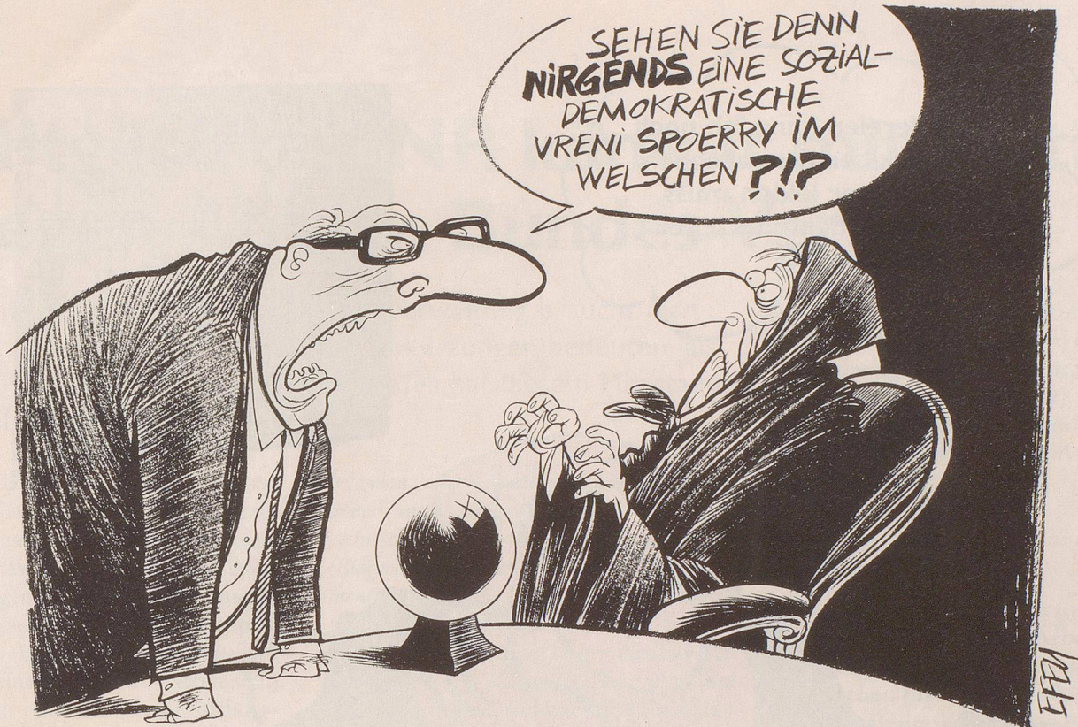
Der Konsens darüber, dass wieder eine Frau dem Bundesrat angehören sollte, ist sehr breit. Bürgerliche Kreise sehen die ganze Angelegenheit aber mit ein paar kleinen Einschränkungen ...