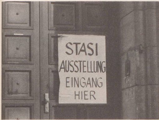
5 ... von lieb gewordenen Gewohnheiten.