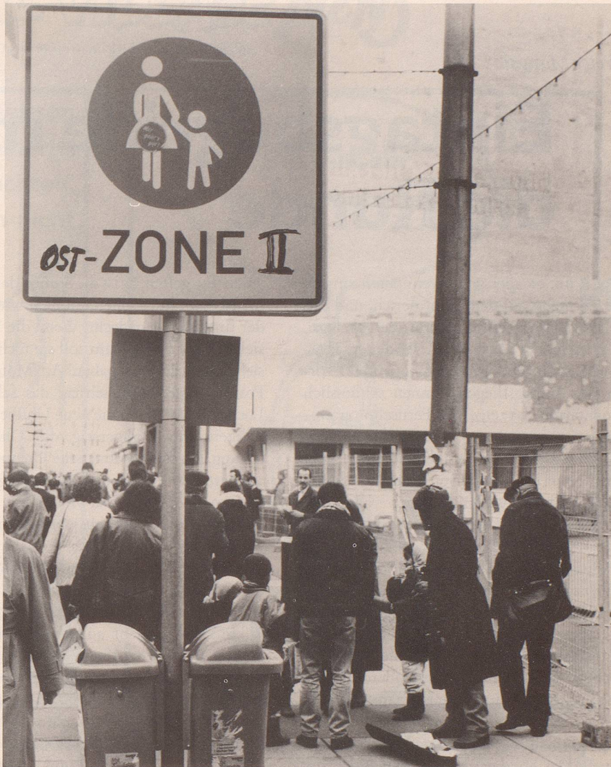
8 Doch wenn man die Lage nüchtern betrachtet, ...