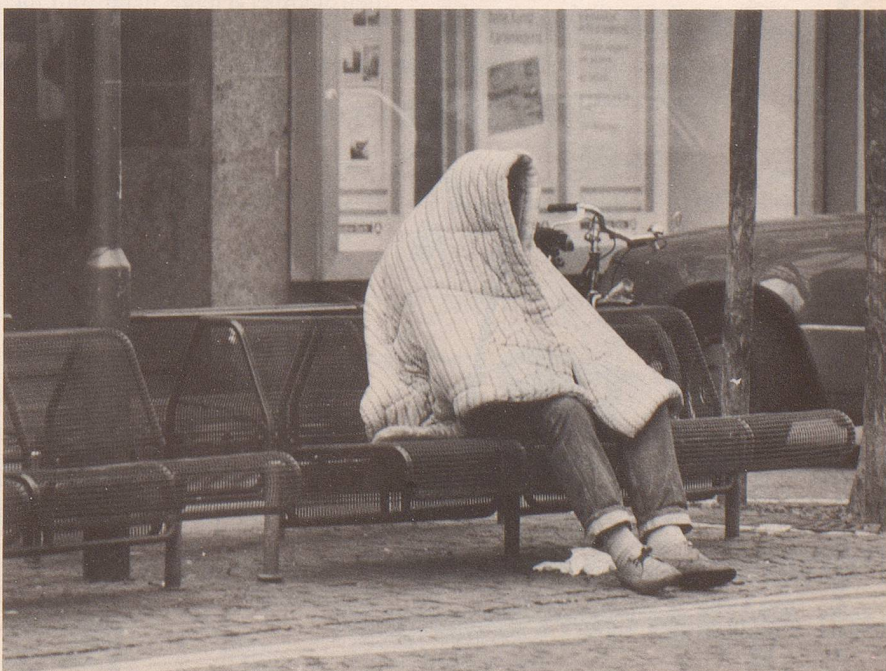
9 ... blieb manches beim alten.