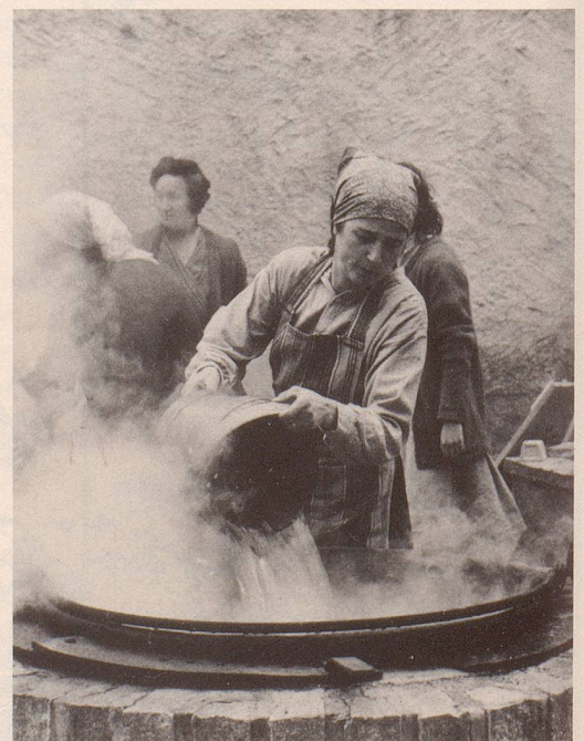
4 ... erleichtert dem Volk der DDR den Abschied ...