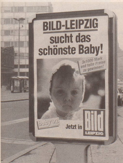
7 ... besser und schöner!