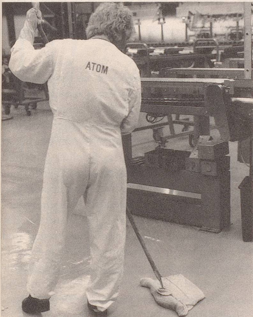
6 Alles wurde sauberer, ...