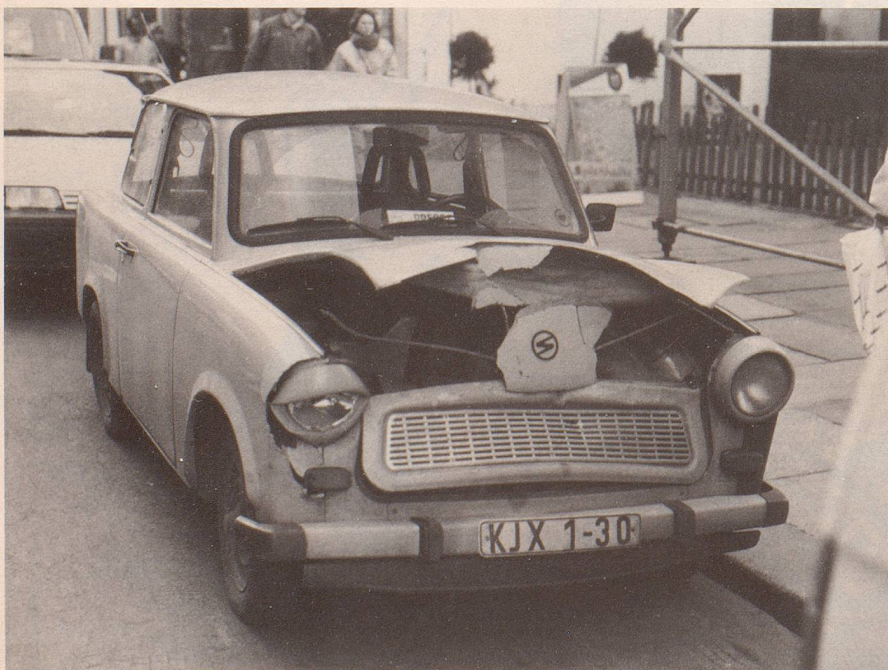
2 ... den bestraft das Leben.»