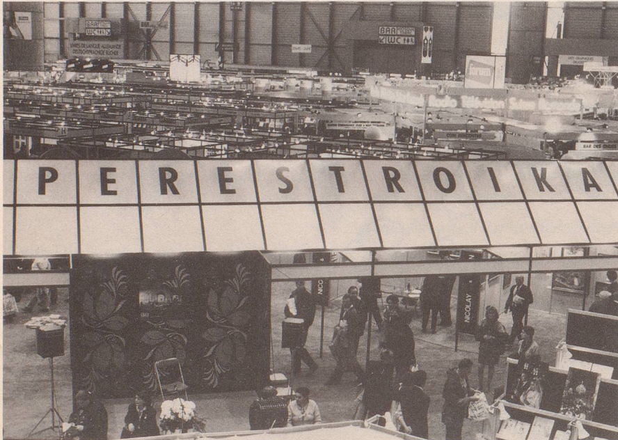
1 Gorbatschow verkündete: «Wer zu spät kommt, ...