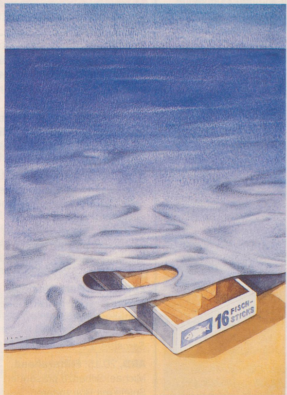
Ökopolitischer Cartoon von Martin Senn