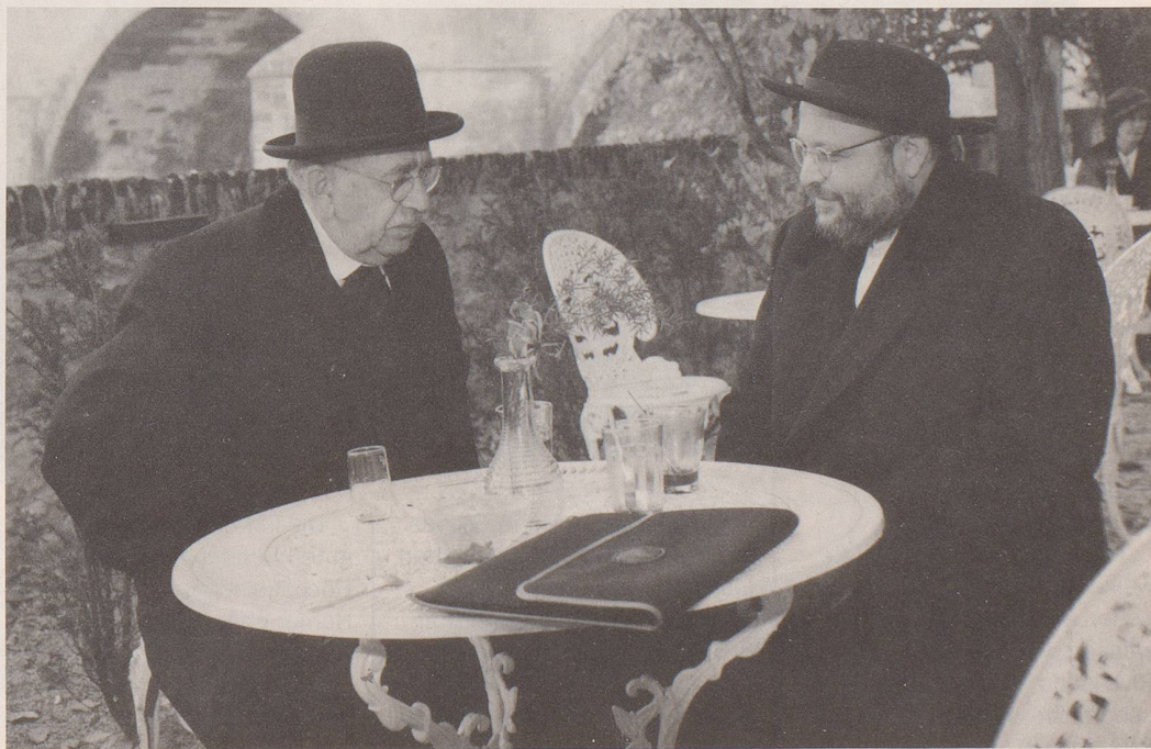
Bronzene Rose der Sparte Humor für den gelungenen Beitrag «Respectful Greetings, Mr. Kohn!» der Cseka Televize aus Prag.