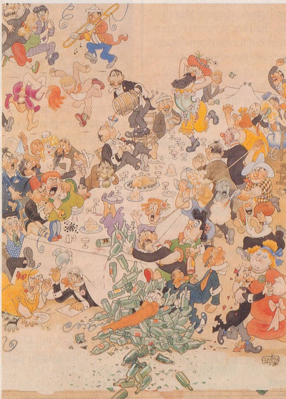
«Neujahrsparty» von Albert Dubout (F)

Die neue Ausstellung der «Sammlung Karikaturen & Cartoons» in Basel zu den Themen «Essen und Trinken» und «Belgien» dauert bis Januar 1994. Öffnungszeiten sind mittwochs von 16 bis 18 Uhr, samstags von 15 bis 17.30 Uhr und sonntags von 10 bis 16 Uhr. Mit den neu dazugekauften Werken aus Belgien umfasst die Sammlung 2'303 Arbeiten von 560 Künstlerinnen und Künstlern aus 35 Ländern.