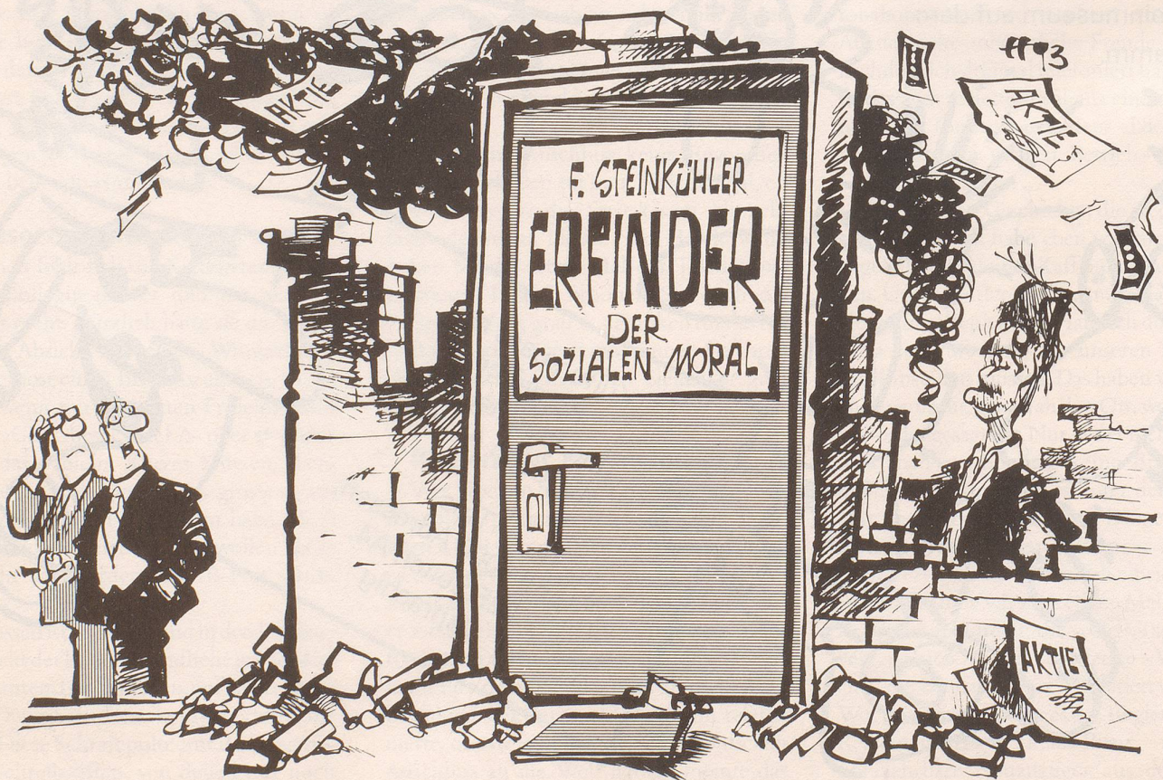
«Dem Genie scheint ein Versuch missglückt zu sein.»