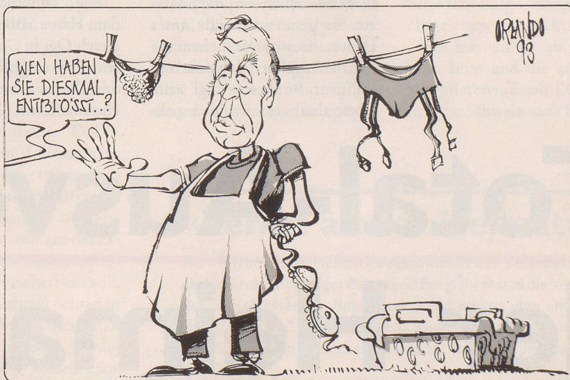
Hat Ziegler selber Dreck am Stecken?