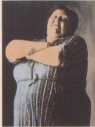
Ursula Anstress, + Schauspielerin: «Mit zunehmendem Alter entwickelt man natürlich Ecken und Kanten. Da wird's schwer, gute Rollen zu kriegen.» 75