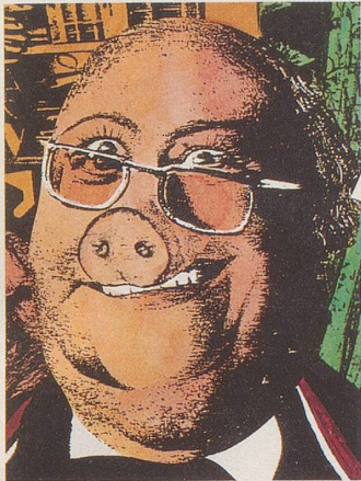
P.R. Ominenter, + Bildschirmer: «Viele TV-Macher sind geistig beschränkt. Sie können mit ihrem Intelligenzspektrum keinen Bildschirm füllen.» 4