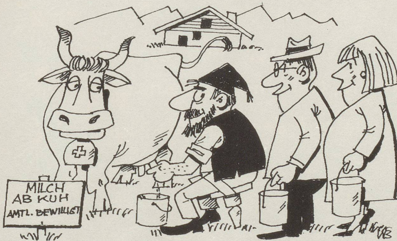
Milchordnung wird neu geregelt

Nach fünf Jahren, einwandfreier Leumund vorausgesetzt, dürfen sie über einen Drittel ihres Lohnes frei verfügen. Die Empfängnisverhütung ist Pflicht. Für jedes Kind muss ein begründeter, befristeter Antrag eingereicht werden. Zur Gesundheitsbetreuung sind Spezialärzte einzusetzen. Wir denken dabei an Studienabgänger, die sich so, praxisgerecht, in ihren schwierigen Beruf einarbeiten können. Grössere Investitionen, Autos, Wohnungseinrichtungen usw., bedürfen einer Sondergenehmigung. Ausländer sind ein weites Potential. Unser ausgereiftes Konzept trägt dem Rechnung. Beide Seiten haben so Gewähr für das einwandfreie Funktionieren nebeneinander.