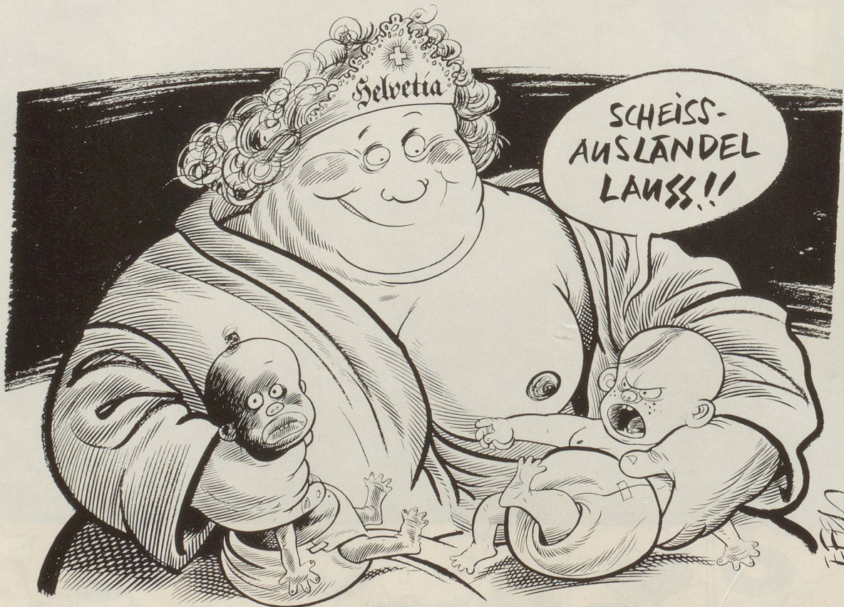
Laut einer Umfrage der Sonntags-Zeitung denken die meisten Jugendlichen ausländerfeindlich. Eingesogen mit der Muttermilch?