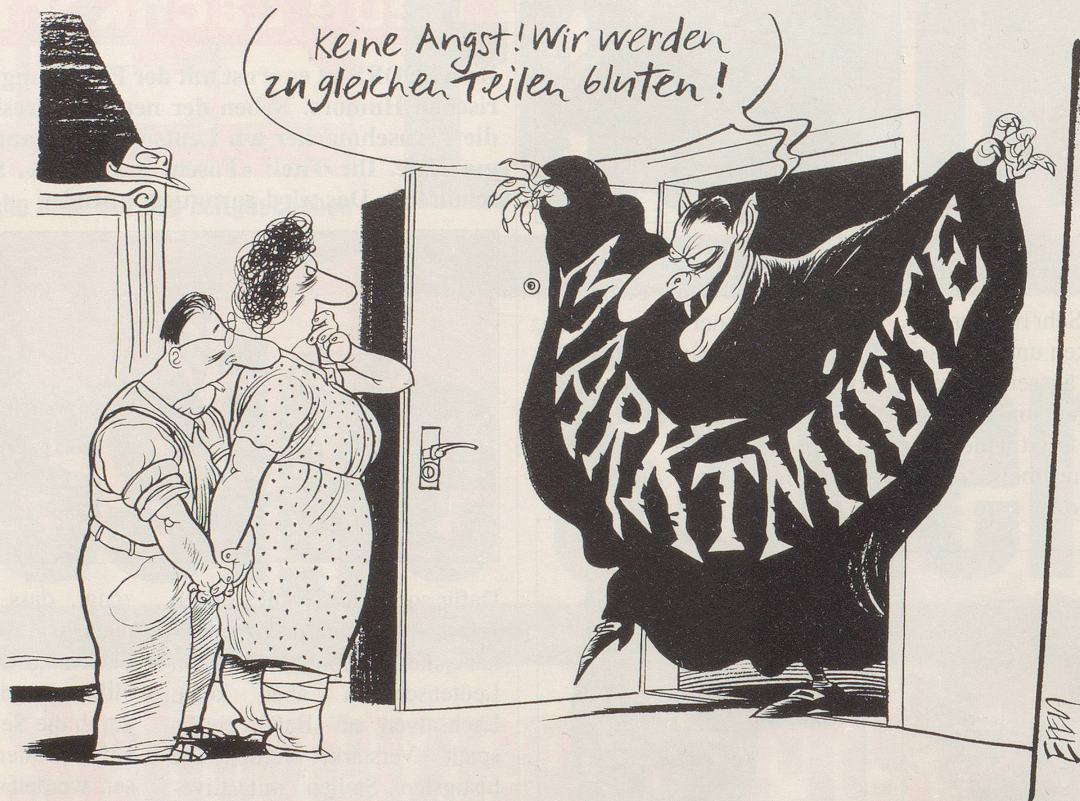
Die Marktmiete komme speziell auch den MieterInnen zugute, behaupten bürgerliche Kreise.