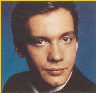
Blah Blödie: Megacool!