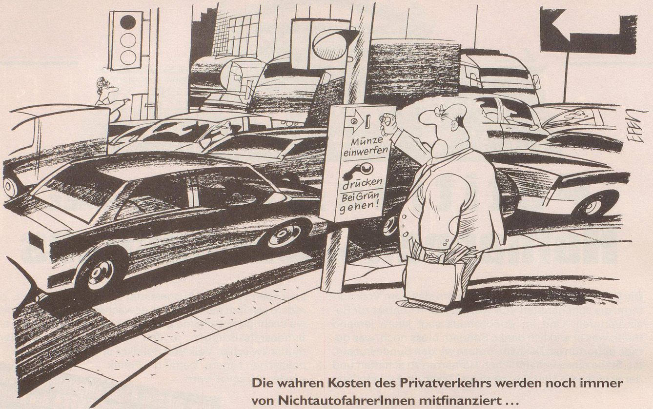
Die wahren Kosten des Privatverkehrs werden noch immer von NichtautofahrerInnen mitfinanziert ...