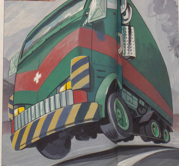
Bald ein seltenes Bild? Schweizer Brummi auf freier Wildbahn!

Werni, LKW-Fahrer: Stellen Sie sich vor, er dürfte nicht mehr auf seinen Rädern fahren!