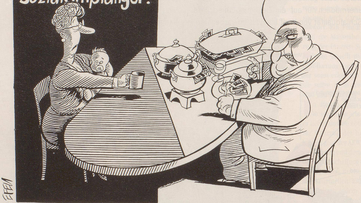
Sozialpolitischer Zündstoff zur Jahrtausendwende ...