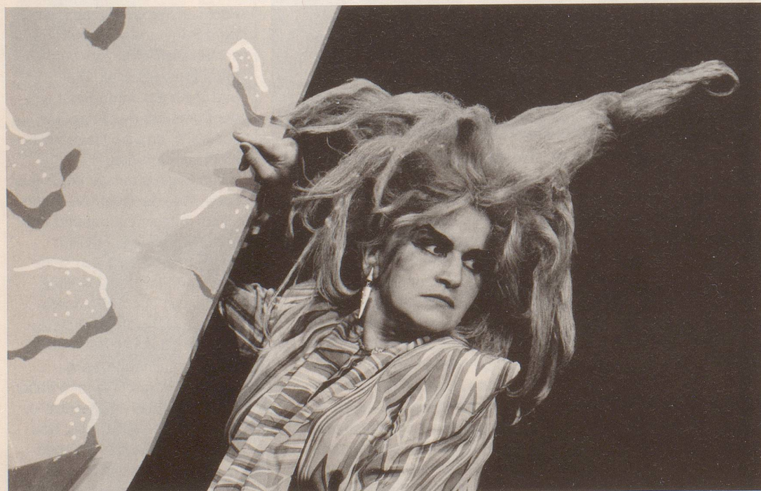
Schwierige Gratwanderung zwischen klamaukiger Komik und verspielter Clownerie: Gardi Hutter

So weicht die Freude über manche witzige Passage dieses Abends der Enttäuschung darüber, insgesamt nur unbedeutenden Klamauk gesehen zu haben. Gardi Hutters Schlusspointe aus der Mottenkiste rundet das Ganze treffend ab: «Die Zukunft ist auch nicht mehr, was sie einmal war.» Schade.