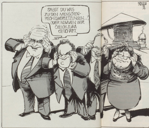
Besuch aus China

oder aber dass sich das Gesamtkollegium dazu durchringen kann, die drei überzähligen Staatssekretäre als Springer einzusetzen, die einmal diesem und ein anderes Mal jenem Bundesrat die Mappe tragen dürfen.