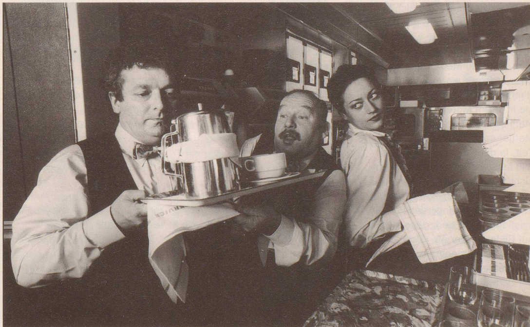
Spiiswage-Saga: Im Intercity nach Nirgendwo