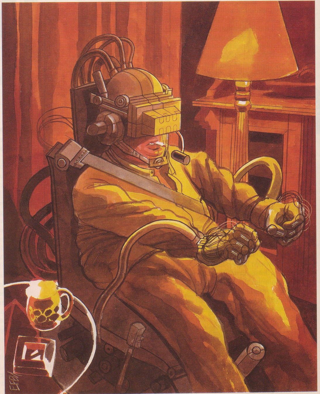
Alkoholisiert, bekifft oder medikamentös verladen? Am Steuer des CYBERCARs kein Problem!

wählen Sie Ihren Lieblingswagen. Ein Knopfdruck – und der Computer schaltet auf die Leistungsbasis und das Fahrverhalten eines Ferraris. Oder Sie wählen Rolls-Royce Trabi MG(B) VW-Käfer Mustang COBRA (insgesamt stehen über zehn