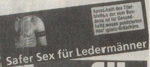
Ausschnitt des Titelblatts der vom Bundessozialversicherungsamt herausgegebenen Broschüre «Safer Sex für Ledermänner»