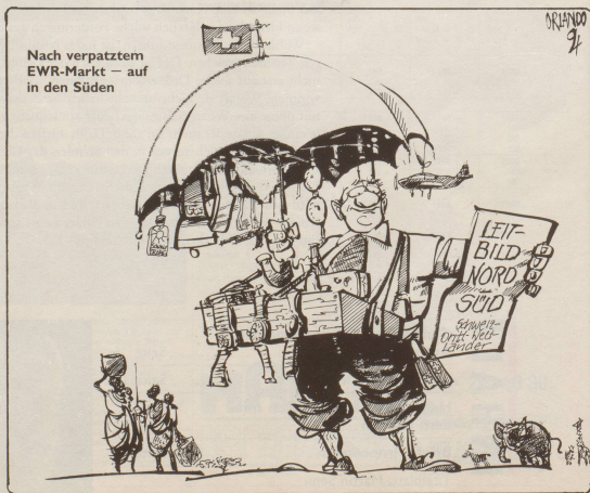
Nach verpatztem EWR-Markt – auf in den Süden