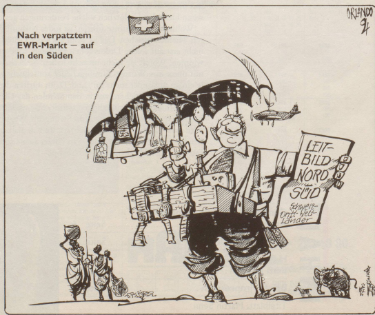
Nach verpatztem EWR-Markt – auf in den Süden