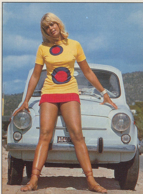
Knie: «Clownin mit Fiat» (links), «Die verirren Clowns» (rechts). Wahre Kunst!