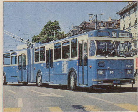
H.R. Giger: «Der Satans-Trolley». Kein Auto?

Panda: Als die Frau vom Mann? Eine Sonnenbrille von einer Mondfinsternis? Der Turm von Pisa von der Andreas-Spalte?