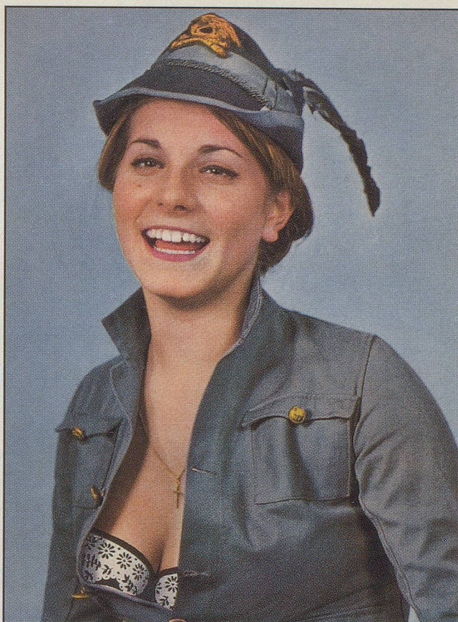
Beuys: «Fettecke mit Filzhut». Pfui!

Prof. W. Frey: Brrrrm, brrrrm... (...und ab.)