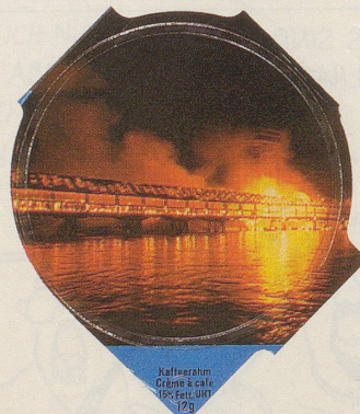
Kaffeebaum Crème & café 150 Fct. Uhr 129

die kunstvoll wiederaufgebaute Holzkonstruktion Feuer fangen wird, werden Heerscharen von Sprinkleranlagen die gesamte Innenstadt längst überflutet haben. Luzern ist dank dem legendären Kapellbrückenbrand