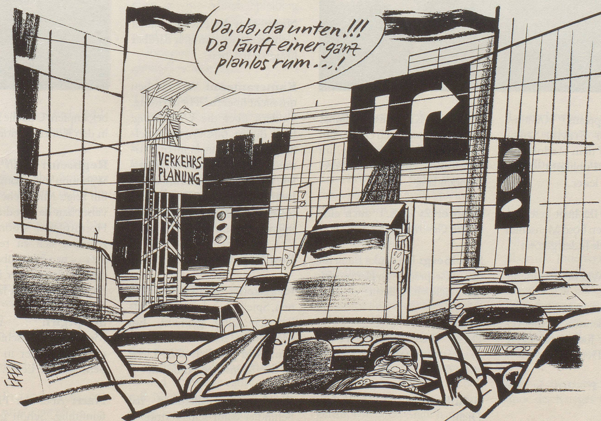
Die Verkehrsplaner entdecken den Fussgänger: Eine Studie dokumentiert den lange Zeit unterschätzten «Fussgängerverkehr» ...